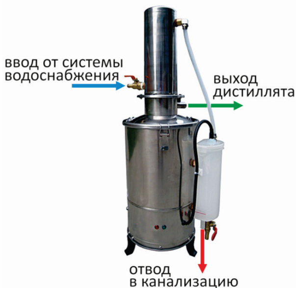
Рисунок 3 – Схема подключения дистиллятора